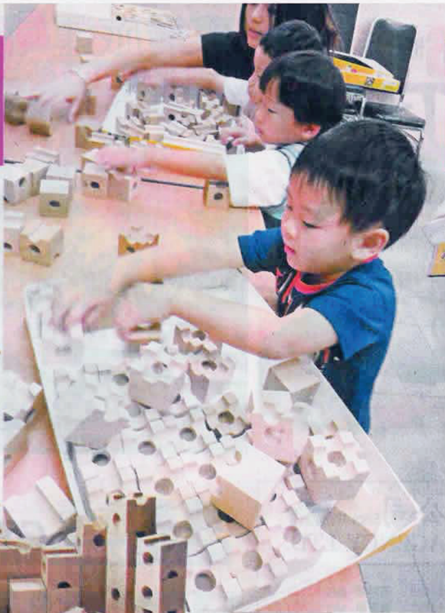
撰文、編輯：李麗輝 美術：梁銘健